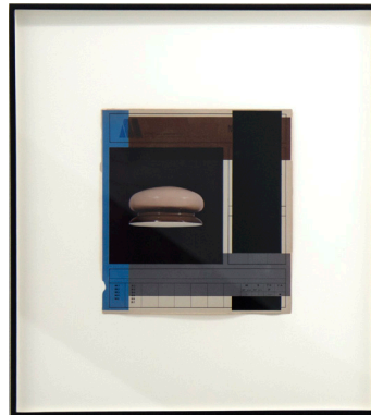
Sin título, 2009 Epson DURABrite inkjet sobre una página de libro 21 x 19,7 cm 41,9 x 41,9 cm (framed)