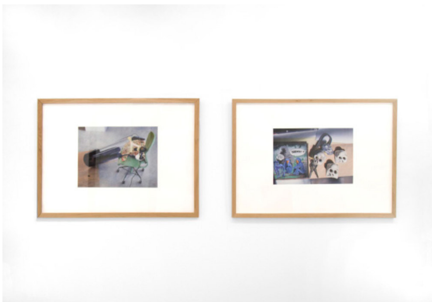
Sin título, 2014 Témpera 70 x 100 cm

Sus obras forman parte de colecciones como: Museo Nacional Centro de Arte Reina Sofía, Grupo Endesa, Arthur Andersen, Peter Stuyvesant Foundation, Banco de España, Unicaja, Caja Madrid, La Caixa, Caja Burgos, Fundación Marcelino Botín, ARTIUM, Coca-Cola, Unión Fenosa, ING Bank o DKV.