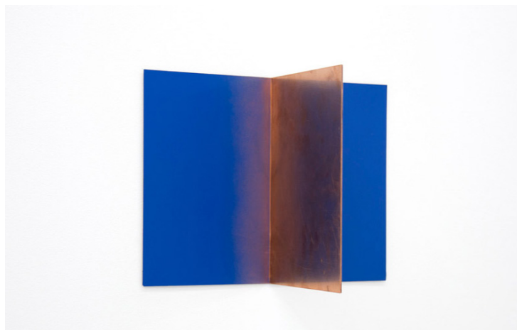
Sin título, 2018 Chapa de cobre, pintura 100 x 62,3 x 10,3 cm