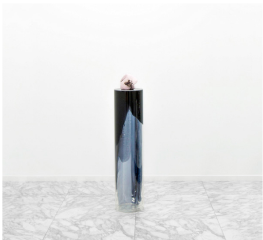
Para Ad Reinhardt, 2014 Óleo y acrílico sobre aluminio Dimensiones variables