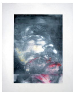
Sin título, 2016 Óleo sobre lienzo 95 x 75 cm 5 works / 5 obra