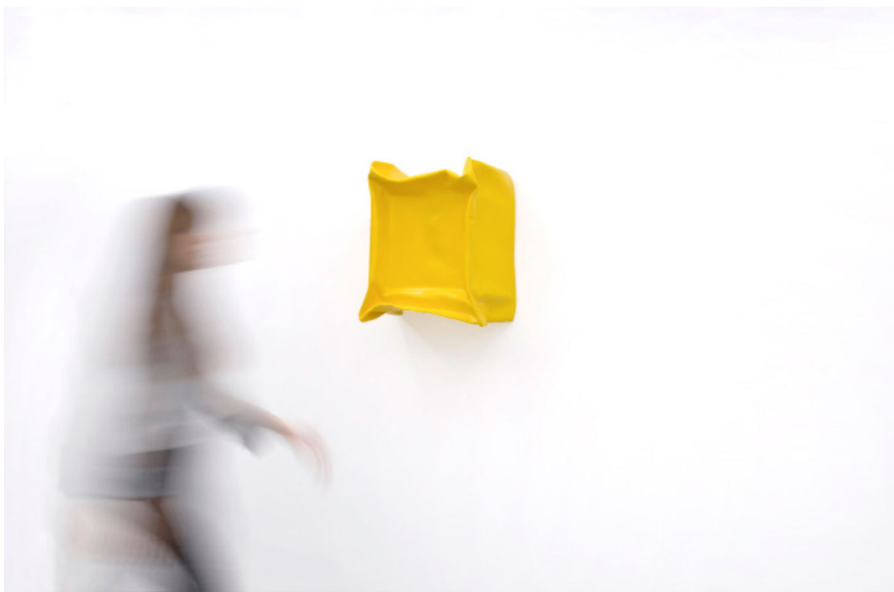
Recycled (Untitled Yellow), 2015

Sus exposiciones individuales incluyen Azkuna Zentroa, Bilbao, España (2018); Peer, Londres, Reino Unido (2016); Galería Wetterling, Estocolmo, Suecia (2016); Fundación Luis Seoane, A Coruña, España (2015); Carreras Mugica, Bilbao, España (2014); Galería Wetterling, Estocolmo, Suecia (2013); Camden Arts Centre, Londres, Reino Unido (2010); Centro Andaluz de Arte Contemporáneo, Sevilla, España (2005); Museo de Arte Contemporáneo de Vigo y Anexo Espacio MARCO, España (2004). Fue nominada para el Premio Turner en 2010 y ha recibido el Premio Nacional de Artes Plásticas 2017, España.