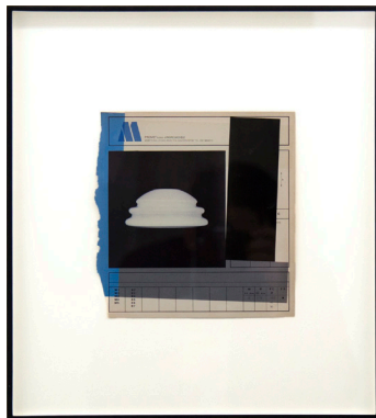
Sin título, 2009 Epson DURABrite inkjet sobre una página de libro 21 x 19,7 cm 41,9 x 41,9 cm (framed)

Guyton ha recibido el premio de Arte 2014 de la Academia Americana de Artes y Letras, la Fundación para las Artes Contemporáneas, 2004; la beca para artistas emergentes Sócrates Sculpture Park, 2003; la beca de proyectos independientes Artists Space, 2002; Delfina Studio Trust, Londres, 2000.