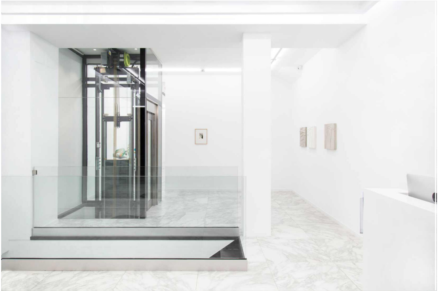
Vista de la exposición