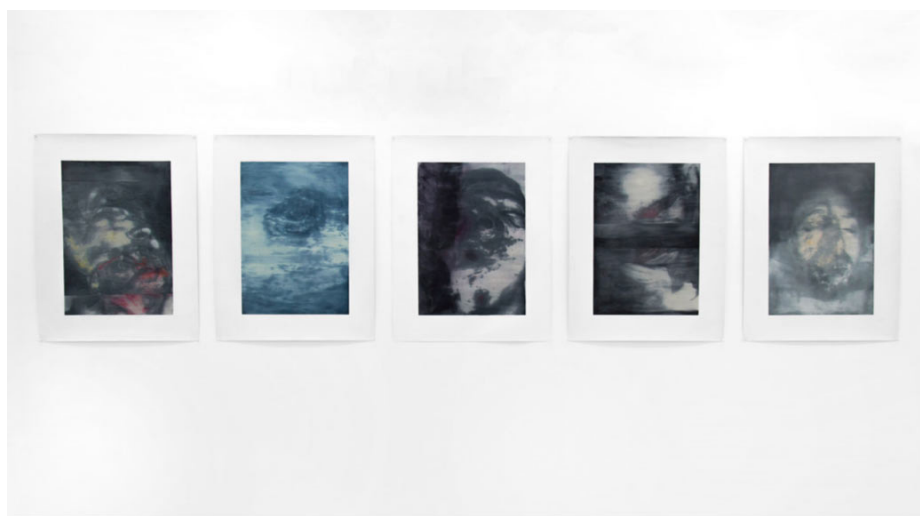
Sin título, 2016 Óleo sobre lienzo 95 x 75cm 5 works / 5 obras

Su obra está presente en el Museo ARTIUM de Vitoria, Museo Unión Fenosa, Fundación CAM de Valencia, MUSAC, Fundación Montemadrid, Fundación Enaire, Colección Banco de España, Colección Ayuntamiento de Pamplona, Fundación Botín, Parlamento de la Rioja, AECID, y Colección Sánchez-Ubiria entre otras.