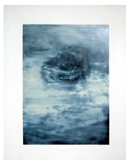
Sin título, 2016 Óleo sobre lienzo 95 x 75 cm 5 works / 5 obra