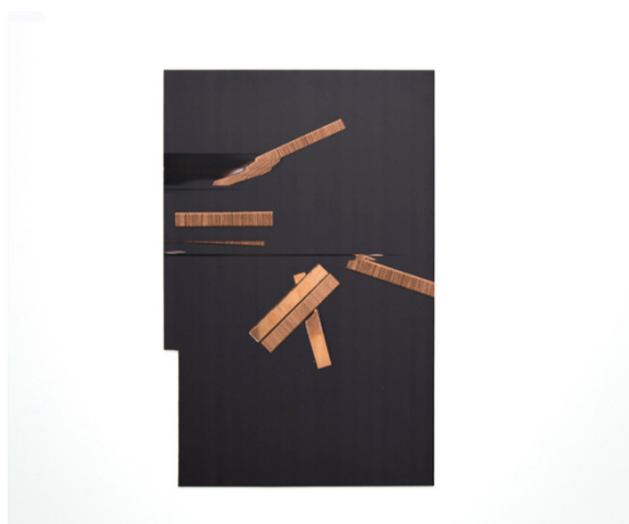
Sin título, 2018 Impresión digital sobre chapa de cobre 100 x 66 cm

Recientemente ha formado parte de una exposición colectiva en KOLDO MITXELENA Kulturunea seleccionada entre artistas jóvenes del País Vasco.