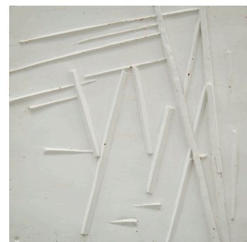
Sin título, 2017 Cemento 46 x 46 x 3,5 cm