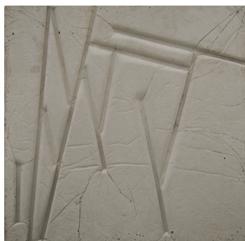
Sin título, 2017 Cemento 46 x 46 x 3,5 cm