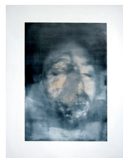
Sin título, 2016 Óleo sobre lienzo 95 x 75 cm 5 works / 5 obra