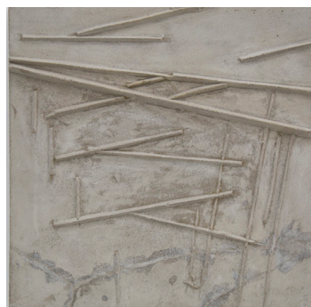
Sin título, 2017 Cemento 46 x 46 x 3,5 cm

Obtuvo, entre otros, el Primer Premio Generación 2000 de Caja Madrid, el Premio Gure Artea del Gobierno Vasco en 2000, la Beca Endesa en 2001 y la Beca Altadis en 2005. Su obra se encuentra en numerosas colecciones públicas y privadas entre las que destacamos: Museo ARTIUM de Vitoria, Colección Unión Fenosa de La Coruña, Colección Arte Contemporáneo Museo Patio Herreriano de Valladolid, Colección CAM de Valencia, Colección Altadis, Colección Caja Madrid, Colección Kutxa, Colección de Junta de Extremadura, Colección de la Comunidad Autónoma de Murcia, Museo de Bellas Artes de Álava, Colección Banco de España, Colección L'Oreal, Fundación Coca-Cola España o los Ayuntamientos de Pamplona y Vitoria.