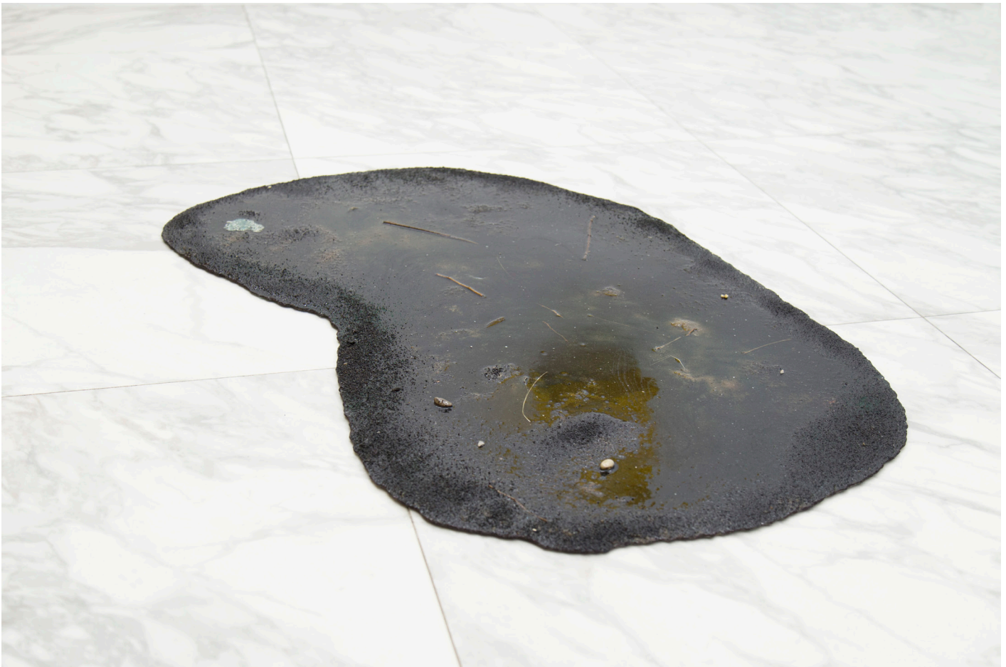
Puddle (String), 2017 Arena, piedras, resina, plástico. 130 x 100

Así pues, convierte colillas de cigarrillos y bolsas de plástico que acaban en charcos en el suelo, en protagonistas absolutas de una exposición, a través de esculturas, instalaciones e impresiones sobre seda. Elevándolas a la categoría de obras de arte.