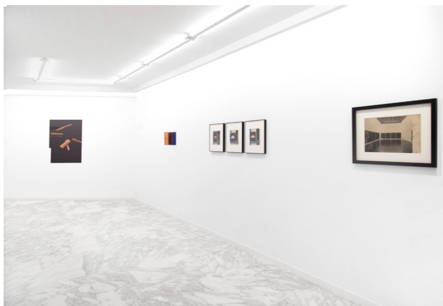
Vista de la exposición