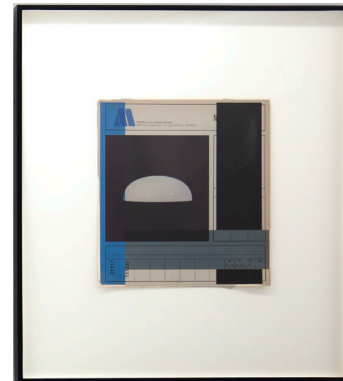
Sin título, 2009 Epson DURABrite inkjet sobre una página de libro 21 x 19,7 cm 41,9 x 41,9 cm (framed)