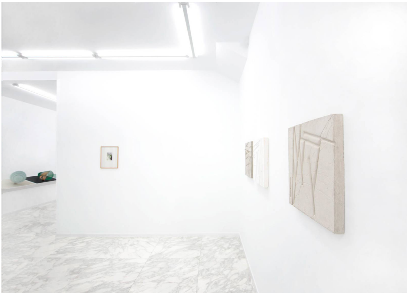
Vista de la exposición